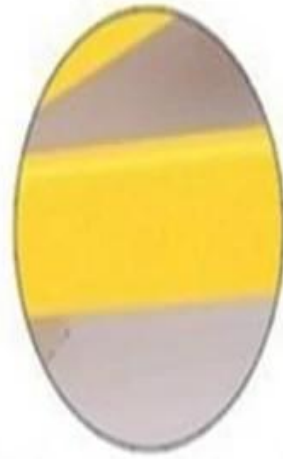
Strong and durable