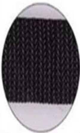
High-quality nylon strap