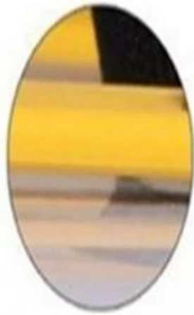
Good toughness of the rung