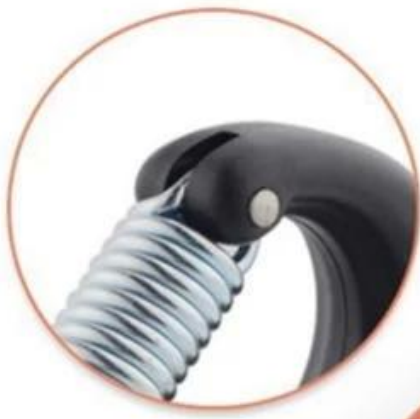
Steel Spring, stainless