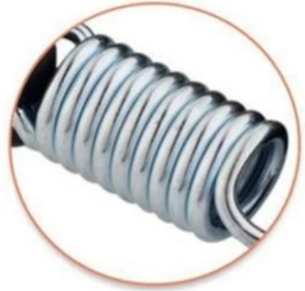
Well fixed, Solid design