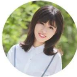
SHANDONG XINGYA SPORTS FITNESS INC.