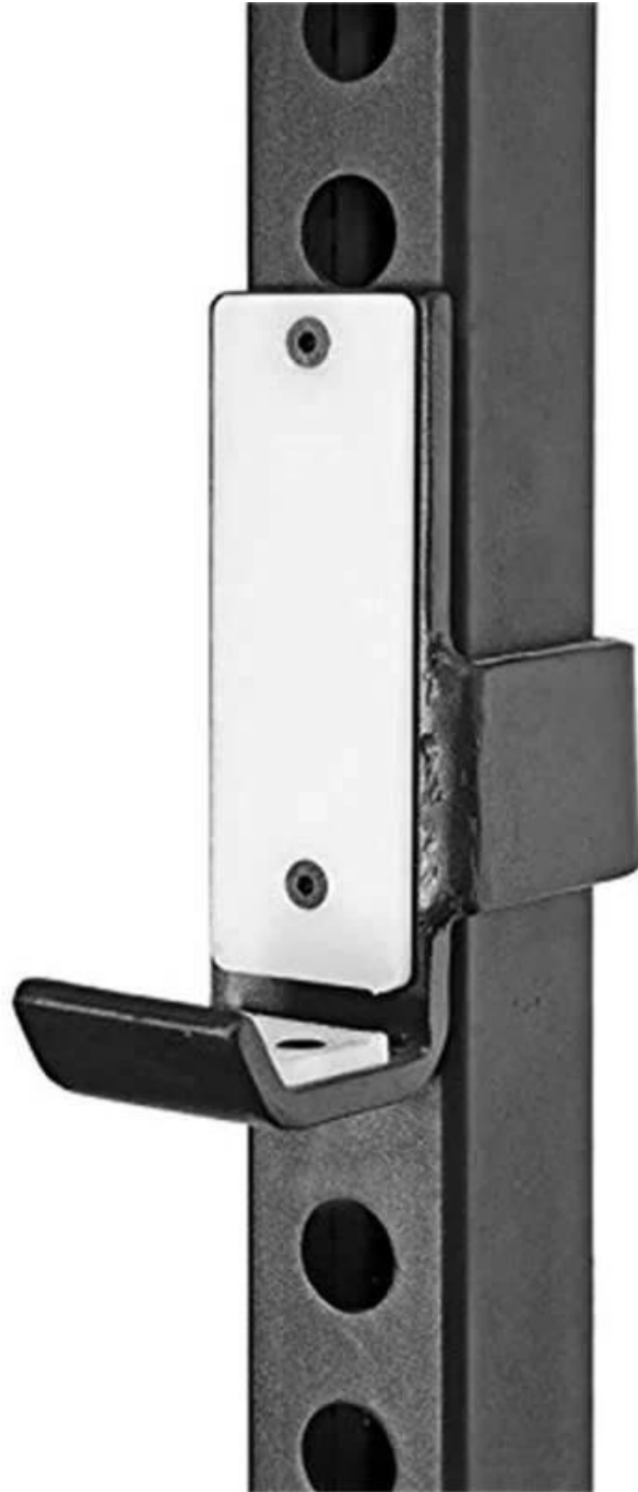
J-hook στο η wall mount πτυσσόμενα squat rack