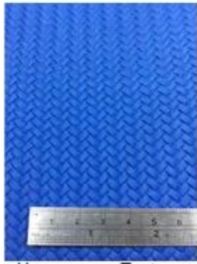
Hemp rope Texture