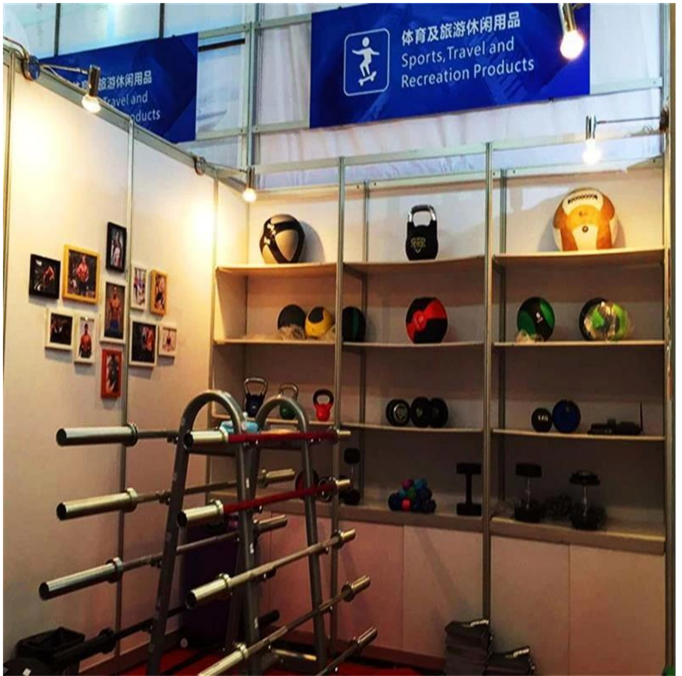
Foto con i clienti