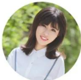
SHANDONG XINGYA SPORTS FITNESS INC.