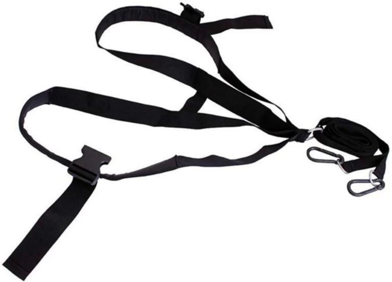
De slee harnas en tow riem met carabiner