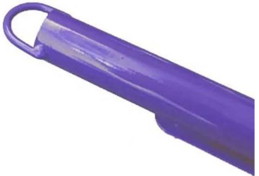
De hangende ring op slee handvat