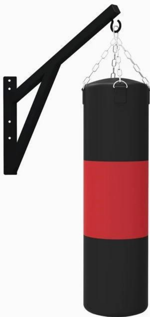
1. Stevige ophangketting