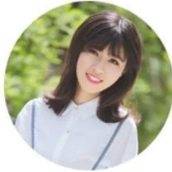
SHANDONG XINGYA SPORTS FITNESS INC.