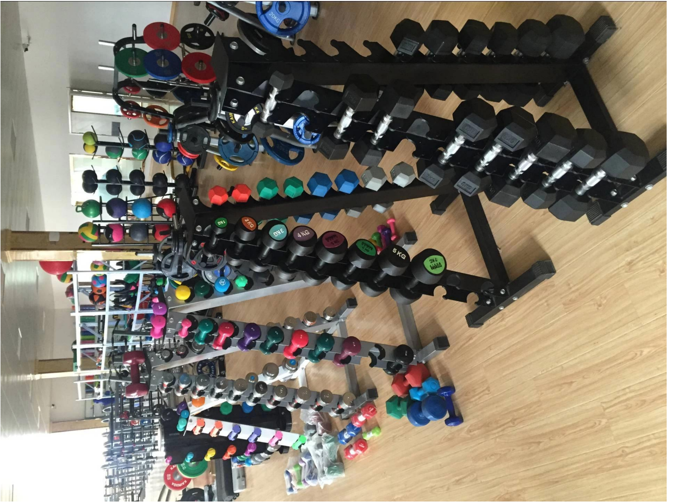
Paczki i przesyłki