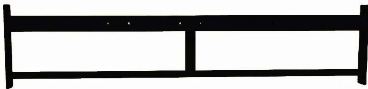
O Dual Pull Up Bar-2 para 1,8 m