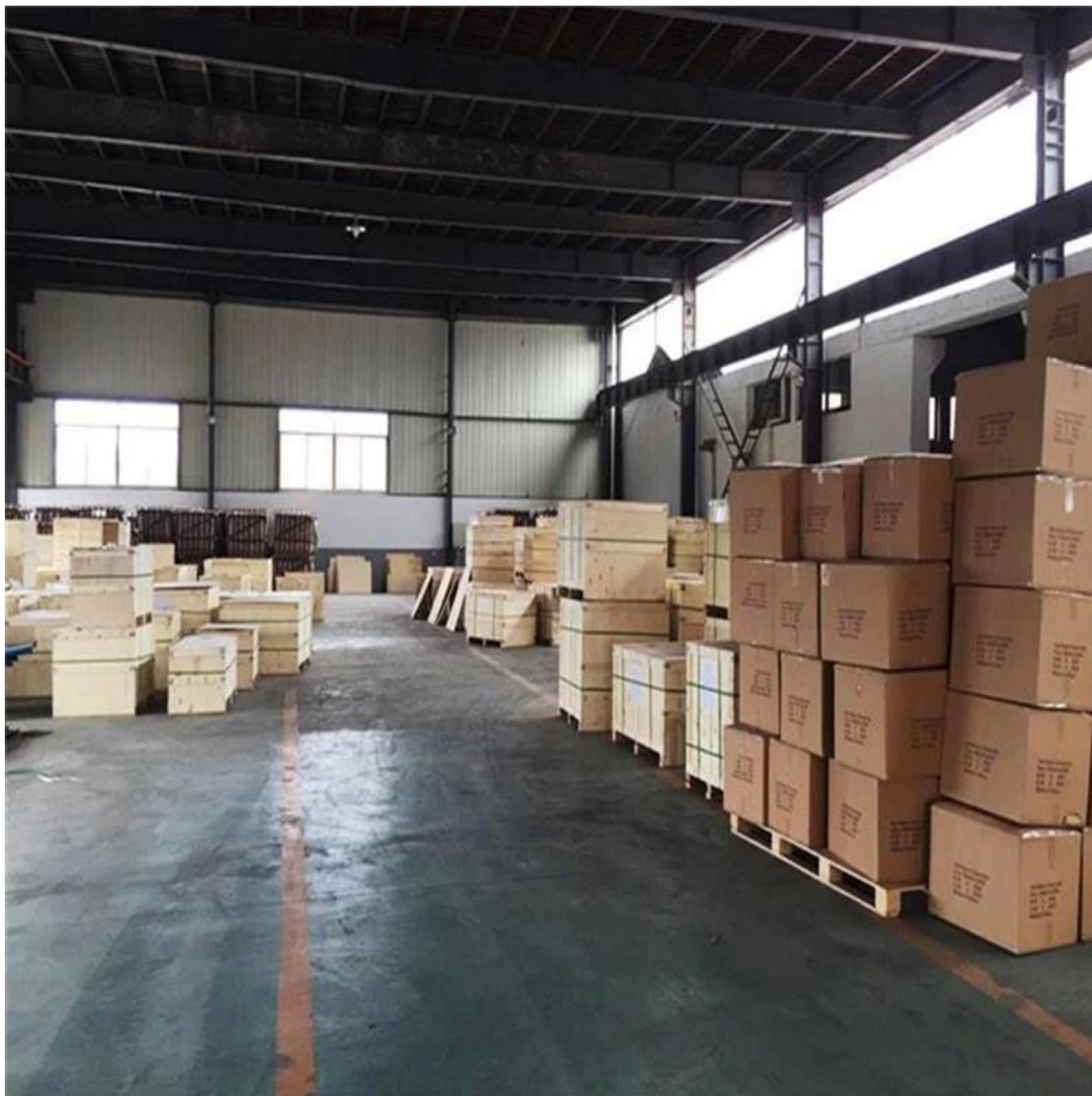
Foto da exposição