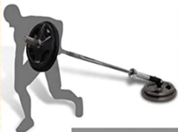
One Arm Row