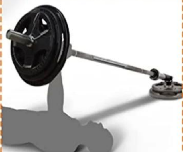
One-Arm Floor Press