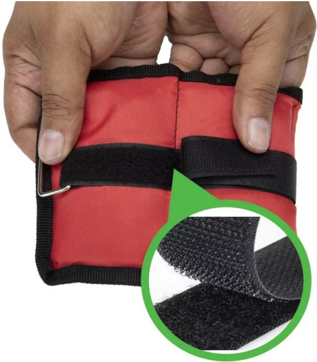
STURDY VELCRO CLOSURE