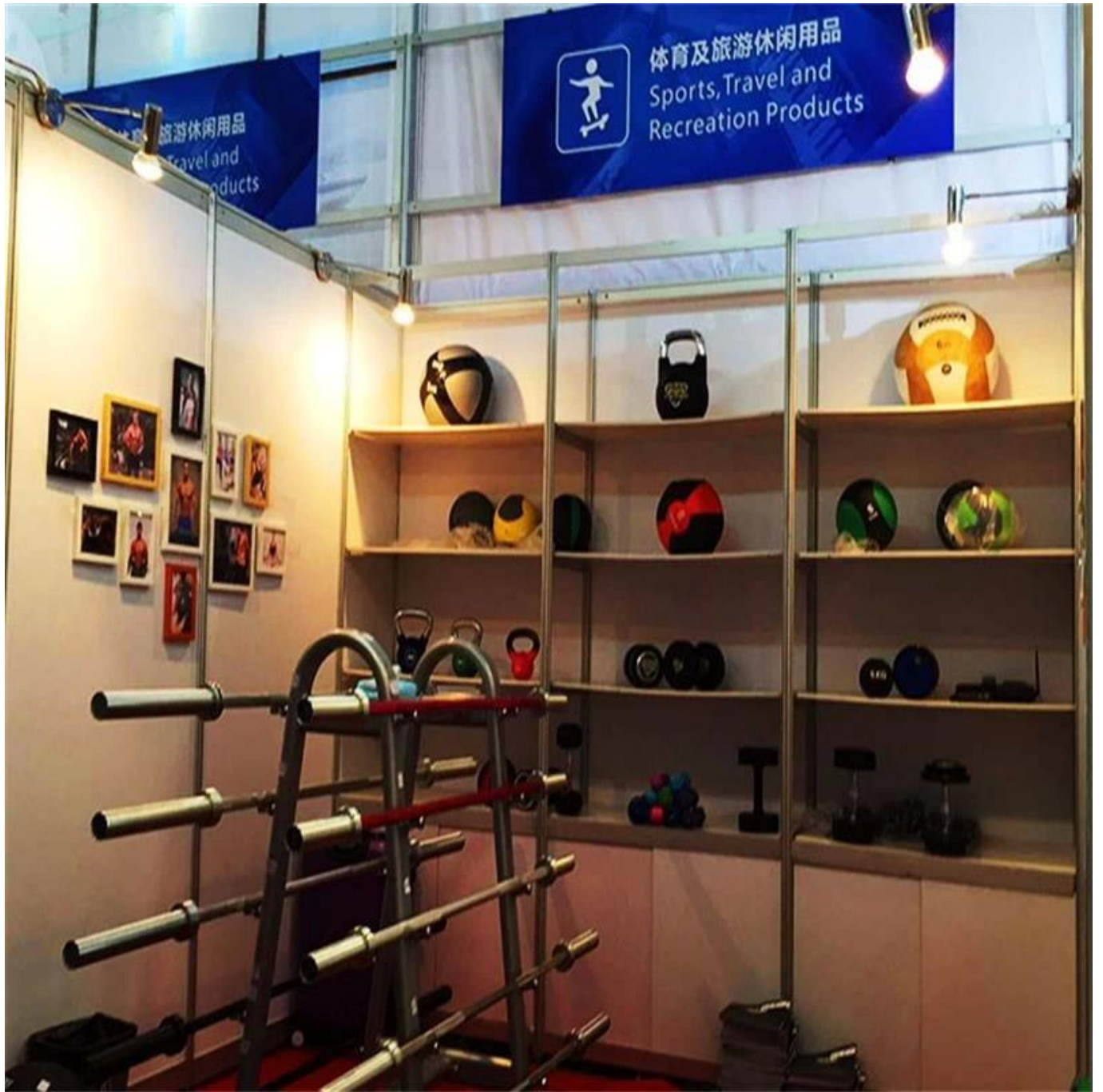
Bild mit Kunden