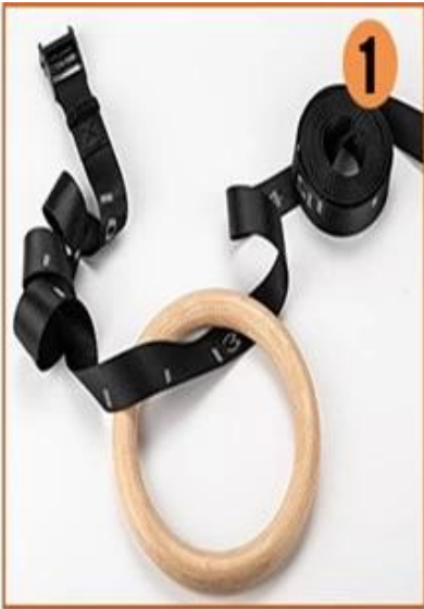
1. Feed the strap through the ring