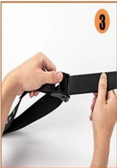
3. Strap starts from the bottom metal and through the metal