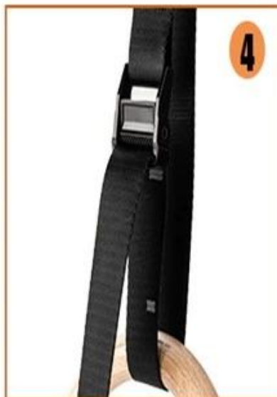
4. The force point is on the bottom metal of the buckle