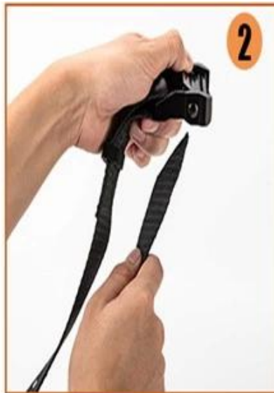
2. prepare the buckle and strap