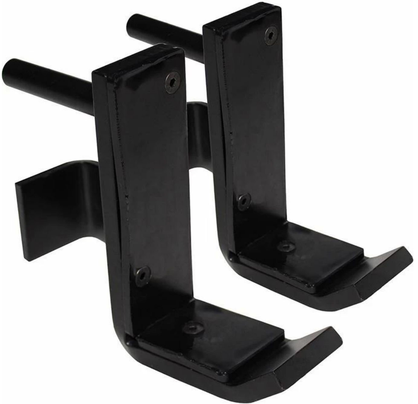
J Haken an einer Wandmontageplattform.