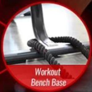
Workout Bench Base