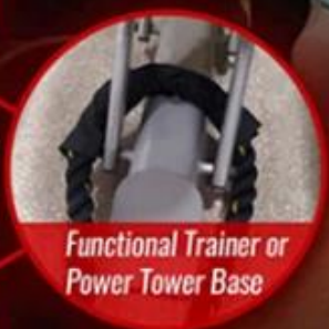
Functional Trainer or Power Tower Base