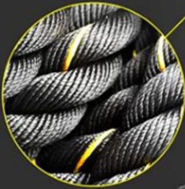
3-strand Twisted Polyester