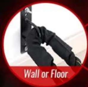
Wall or Floor