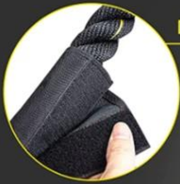
Detachable Protective Sleeve with Velcro