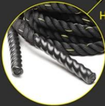
Heat Shrink Grips