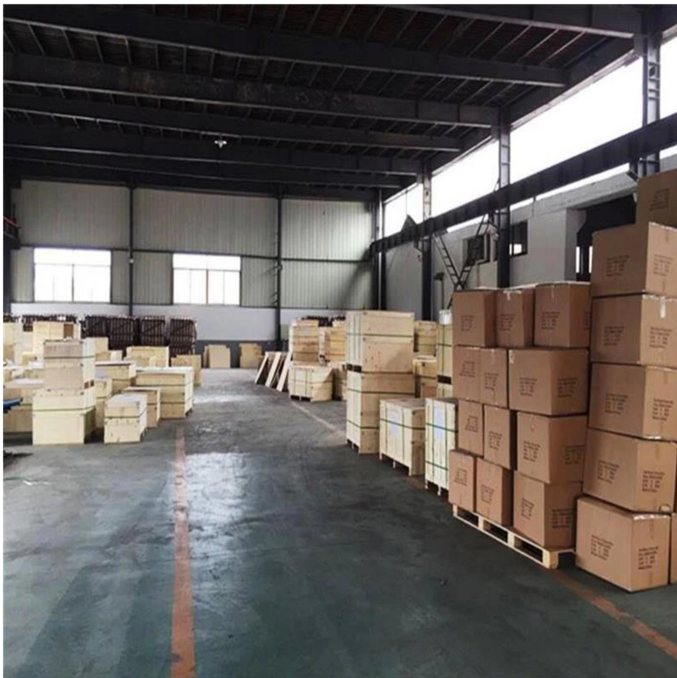
Imagen de la exposición