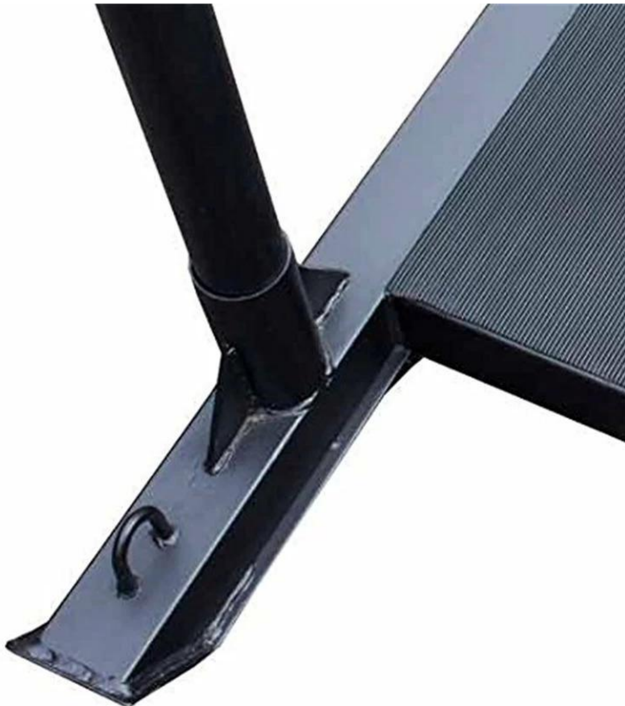
Kelkkaradalla oleva reikä