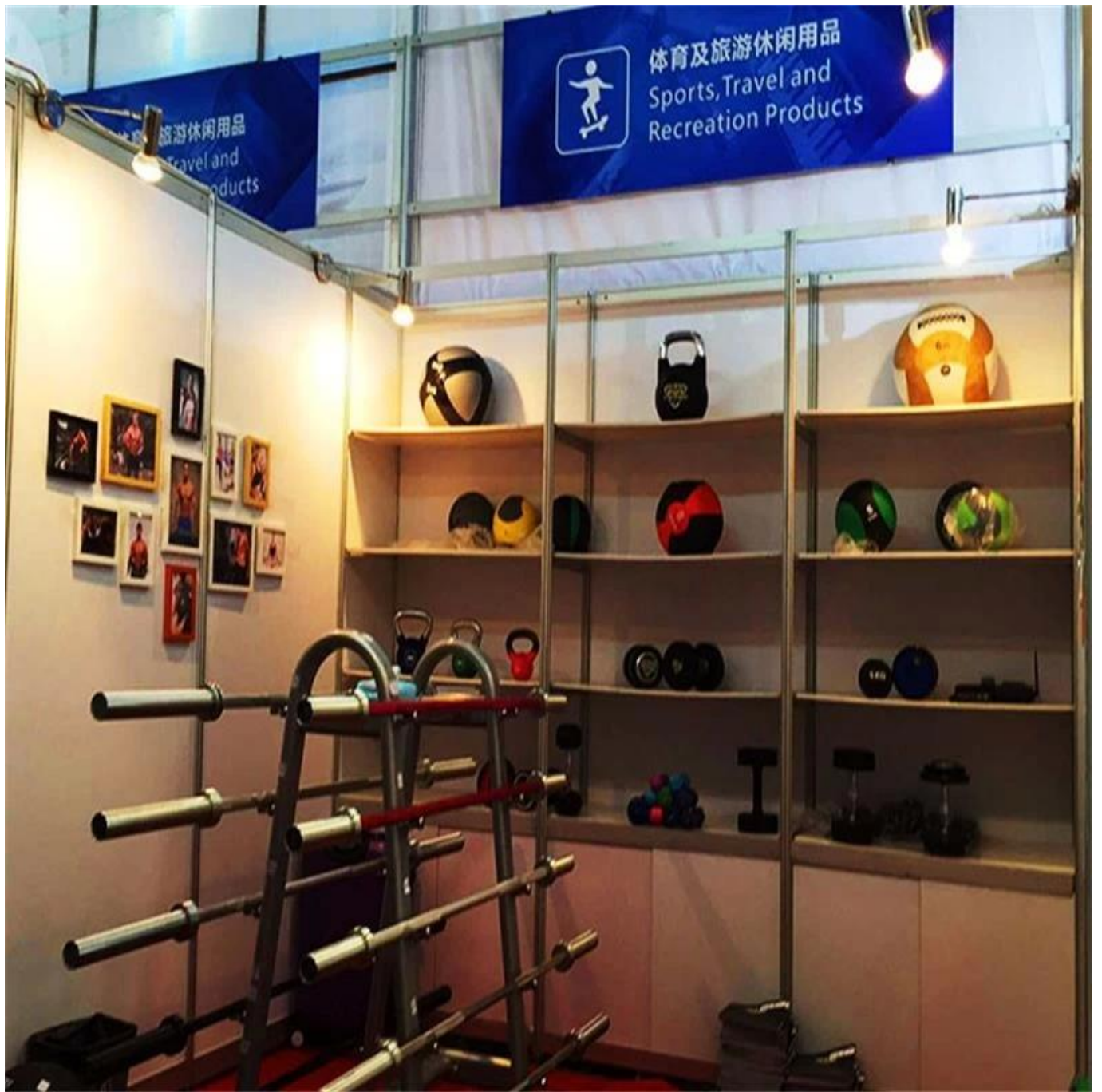
Photo avec les clients