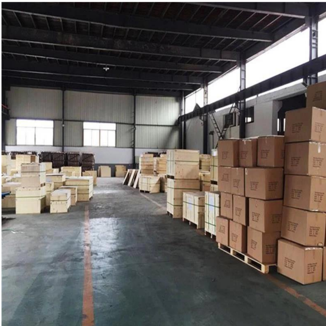
Photo de l'exposition