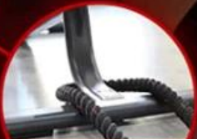
Workout Bench Base