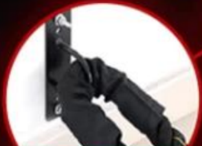
Wall or Floor