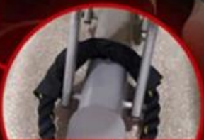
Functional Trainer or Power Tower Base