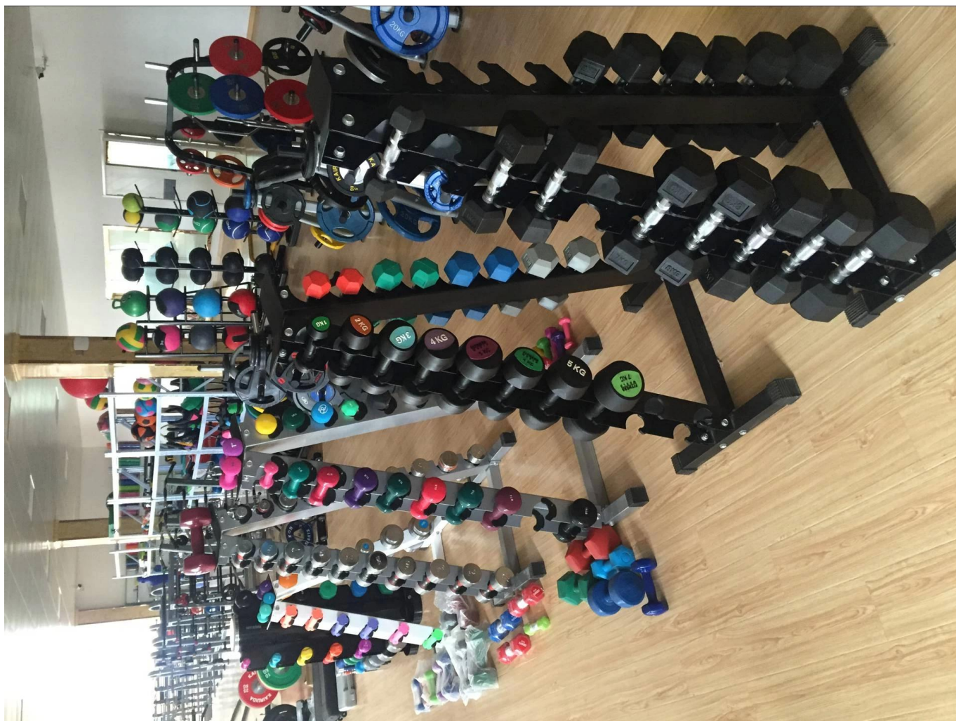
Συσκευασία & αποστολή