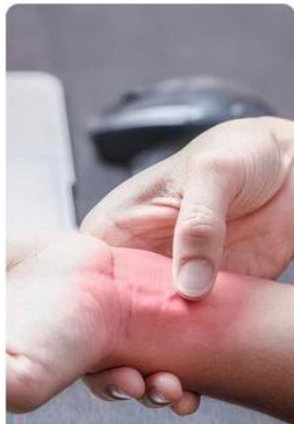
Repetitive Strain Injuries