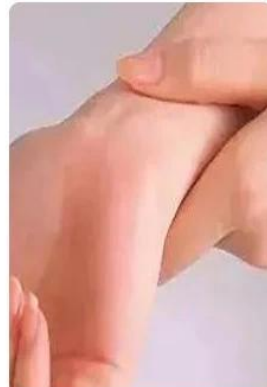
tendon sheath damage

Fashion color matching, enrich your choice