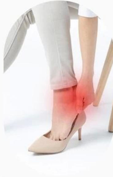
HABITUAL ANKLE SPRAIN