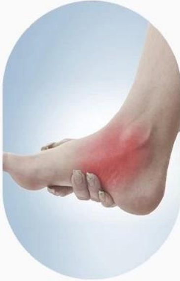
PRONATION OF ANKLE

EFFECTIVE PRESSURE FIXED ANKLE PROTECTION TIGHTEN MUSCLES, REDUCE THE ANKLE JOINT LOAD, SO AS TO AVOID INJURY