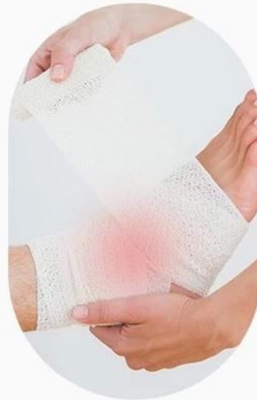
WOUND RECOVERY PERIOD