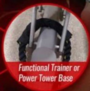
Functional Trainer or Power Tower Base