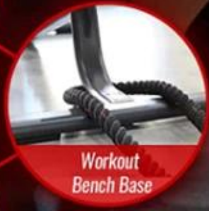
Workout Bench Base