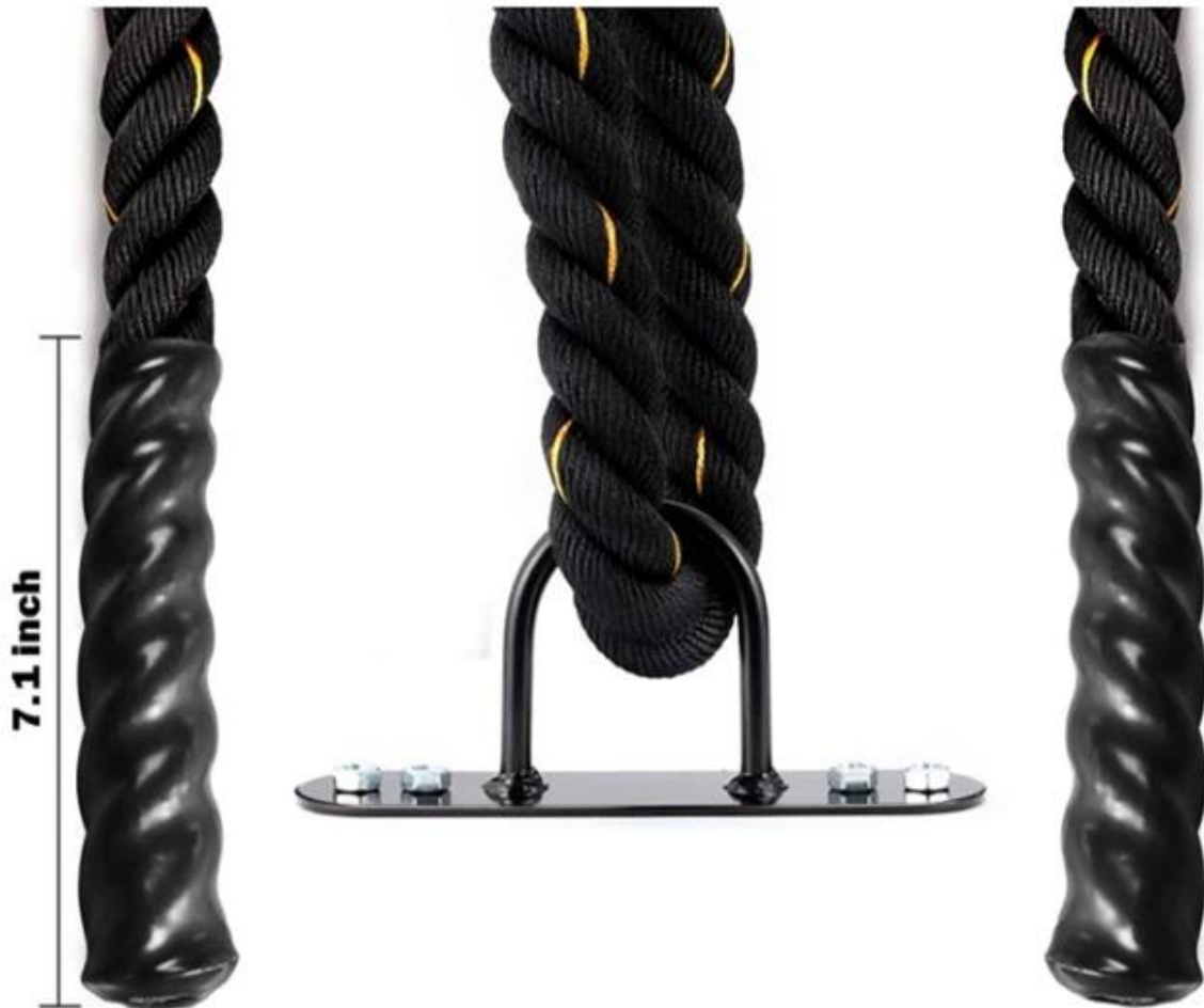
1.5 inch 30ft Length Workout Rope