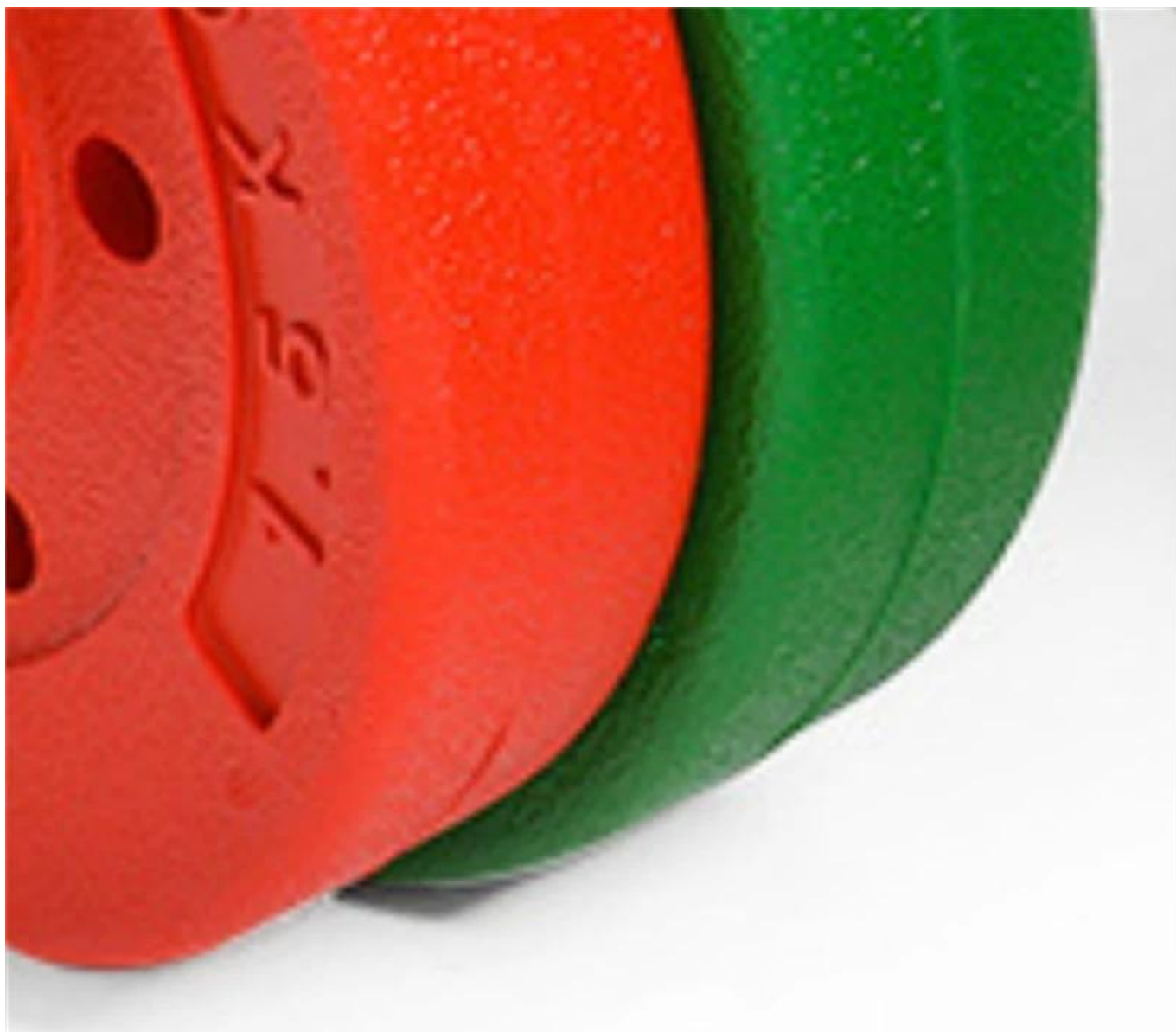
Materiał ochrony środowiska