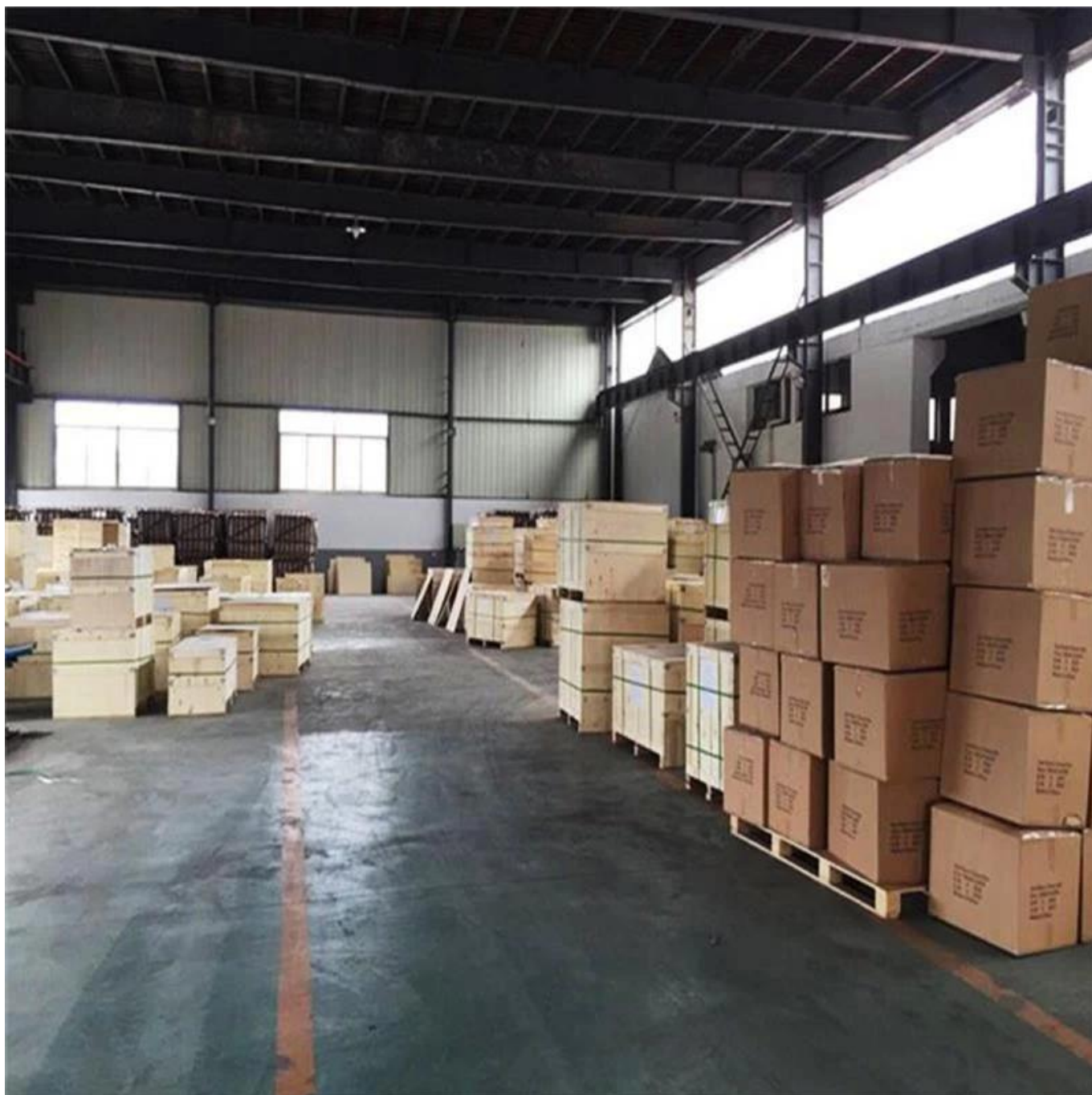
Foto da exposição