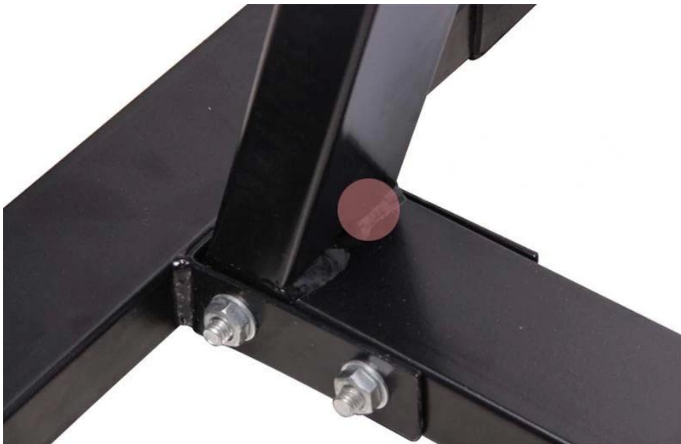
Estrutura triangular poderia estabilize este rack