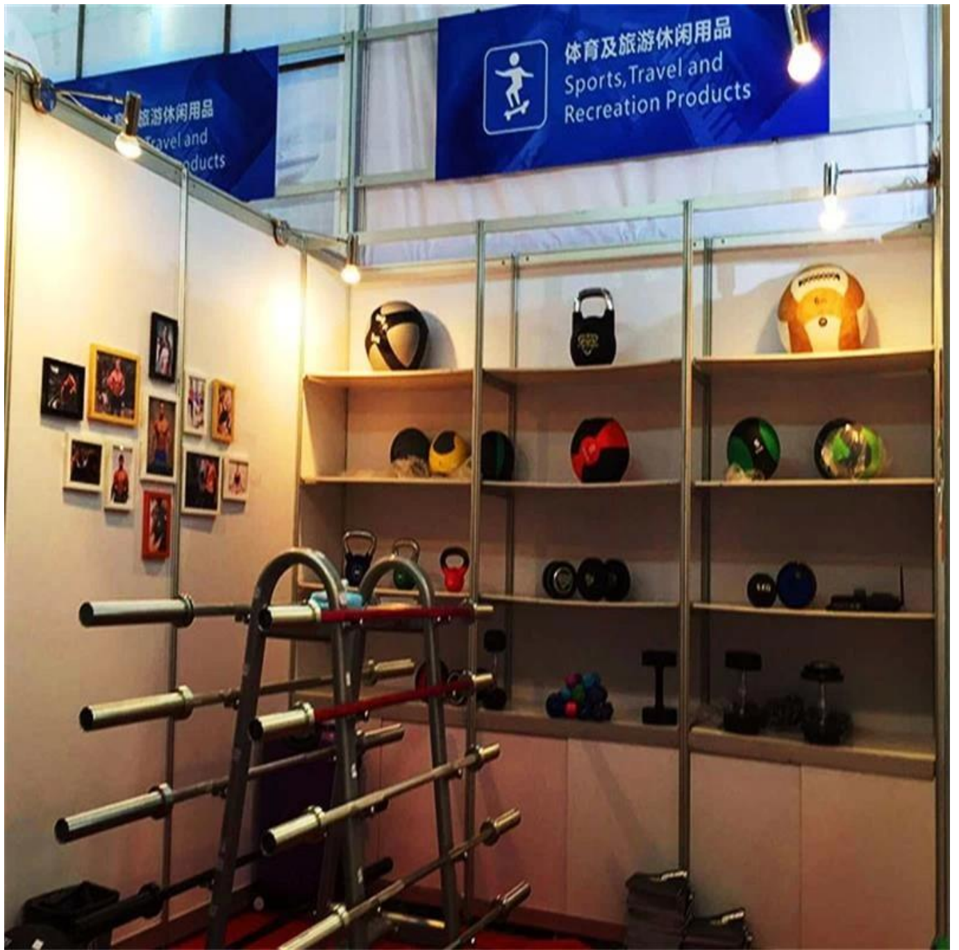
foto com clientes