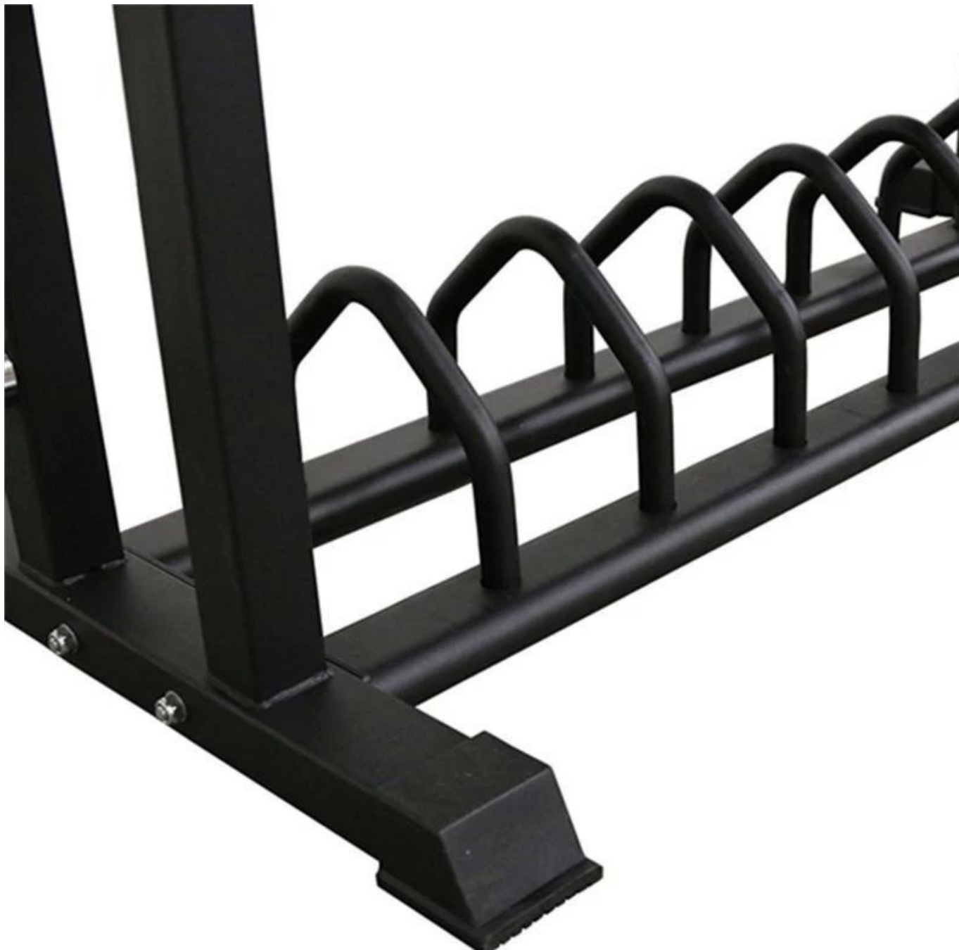
O rack de armazenamento de peso com divisórias de livros