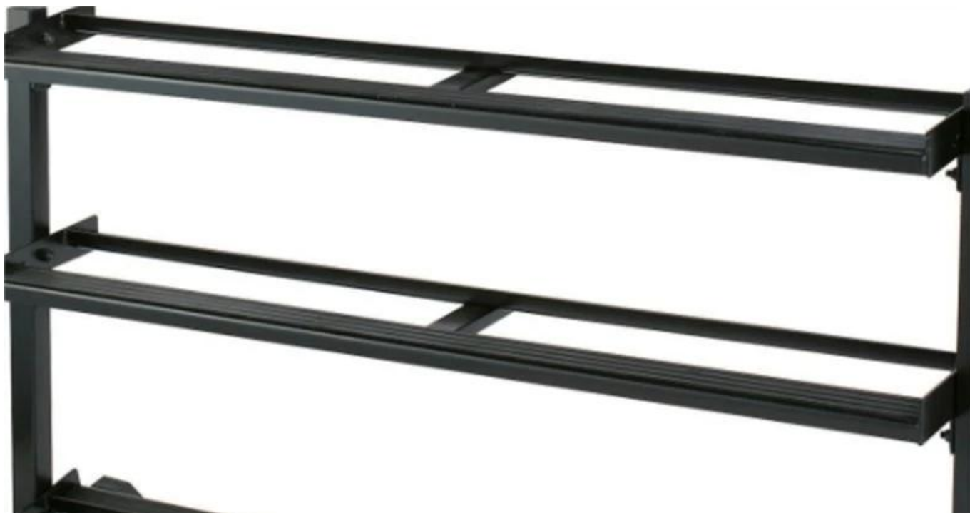
A bandeja de armazenamento de halteres